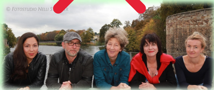
Das Team der MBE freut sich auf Sie! The MBE-team looks forward to you!