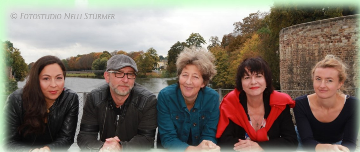
Das Team der MBE freut sich auf Sie! The MBE-team looks forward to you!